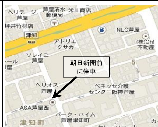
3. Tsuchi-cho – 2:30 pm (津知町)