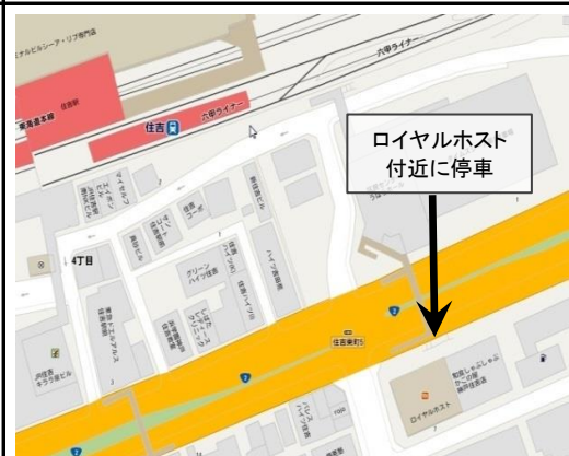
6. JR Sumiyoshi Station – 2:45 pm (JR住吉)