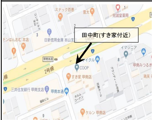
5. Tanaka-cho – 2:40 pm (田中町)