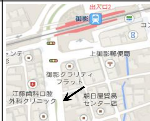
7. Hankyu Mikage – 2:55 pm (阪急御影)