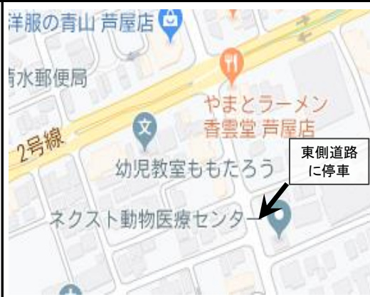
2. Kawanishi-cho – 2:25 pm (川西町)