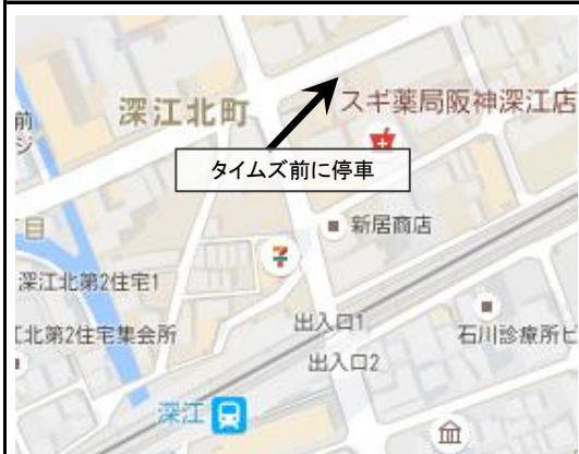
5. Fukae - 2:42 pm (深江)