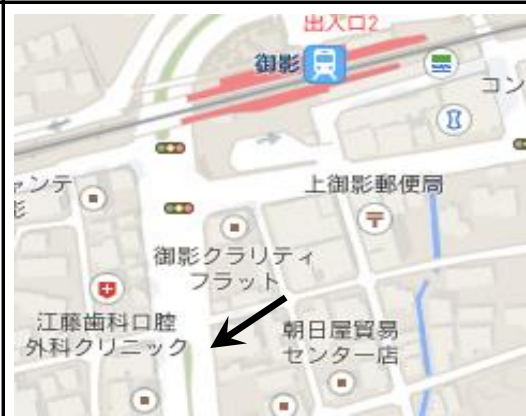
6. Hankyu Mikage - 3:00 pm (阪急御影)