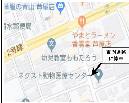
3. Kawanishi-cho - 2:32 pm (川西町)