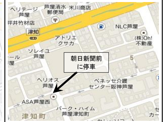
4. Tsuchi-cho - 2:37 pm (津知町)