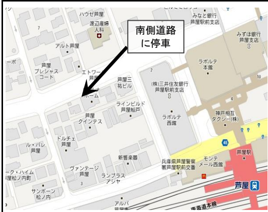
1. JR Ashiya - 2:20 pm (JR芦屋)