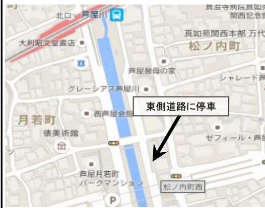
2. Hankyu Ashiyagawa - 2:25 pm (芦屋川)