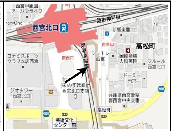
4. Nishinomiya-kitaguchi - 2:40 pm (西宮北口)