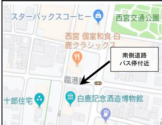
5. Maehama-cho - 2:55 pm (前浜町)