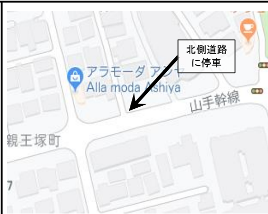
2. Shinnozuka-higashi- 2:25 pm (親王塚東)