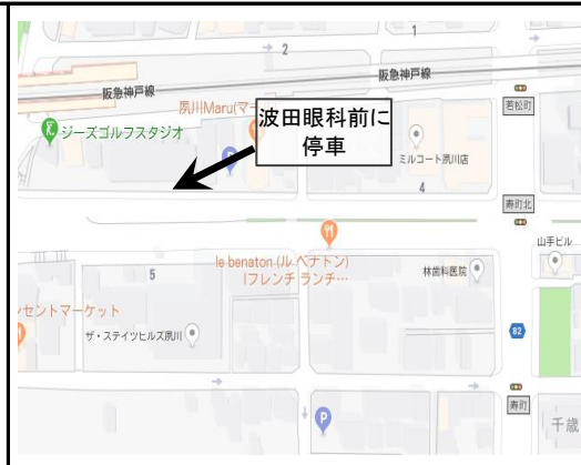
3. Shukugawa Kotobuki cho kita - 2:30 pm (夙川寿町北)