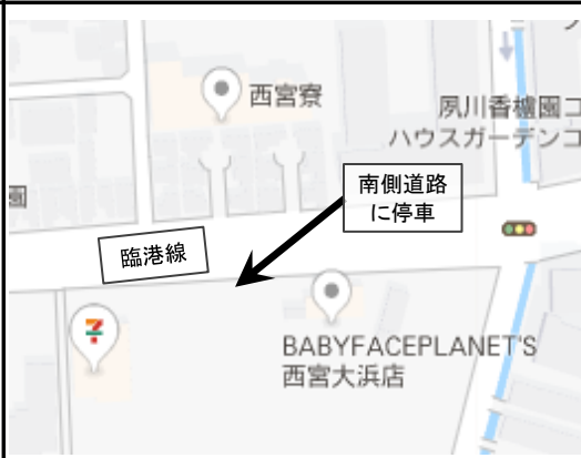
6. Ohama-cho - 3:00 pm (大浜町)